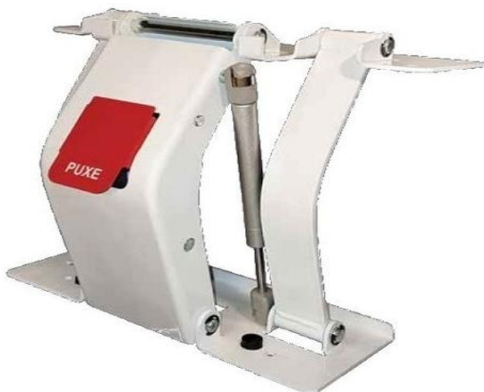
ITEM 7: CONJUNTO DE FREIO TOTAL E28.100 FT – DF