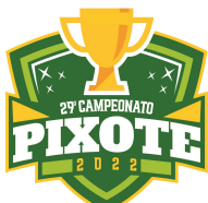
TABELA DE JOGOS VOLEIBOL