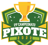
TABELA DE JOGOS VOLEIBOL