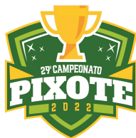
TABELA DE JOGOS FUTSAL