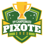
TABELA DO HANDEBOL