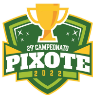
TABELA – FUTEBOL DE CAMPO