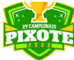
TABELA DE JOGOS BASQUETEBOL

LOCAL DOS JOGOS: GINÁSIO GUSTAVO CID NUNES DA CUNHA "GINÁSIO DA LIXEIRA"