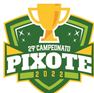
TABELA DE JOGOS FUTSAL