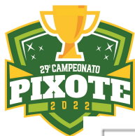
TABELA DE JOGOS VOLEIBOL